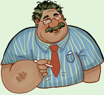
शिक्षक विकास (Teacher Bikas)

“नमस्ते ! इन्टरनेटलाई एउटा विशाल कक्षाकोठा जस्तो सोच्नुहोस् जहाँ सबैले तपाईंको कुरा सुन्न सक्छन् । जब तपाईं आदरपूर्वक व्यवहार गर्नुहुन्छ, अरूको विचारलाई सम्मान गर्नुहुन्छ र बोल्नुअघि सोच्नुहुन्छ, तब तपाईंले सकारात्मक सिकाइ वातावरणमा योगदान गरिरहनुभएको हुन्छ । डिजिटल नागरिक (Digital Citizen) हुनु भनेको तपाईंको सबैभन्दा राम्रो व्यवहारलाई कक्षाकोठाबाट वा भौतिक संसारबाट स्क्रिनमा वा भनौं डिजिटल संसारमा पनि कायम राख्नु हो ।”